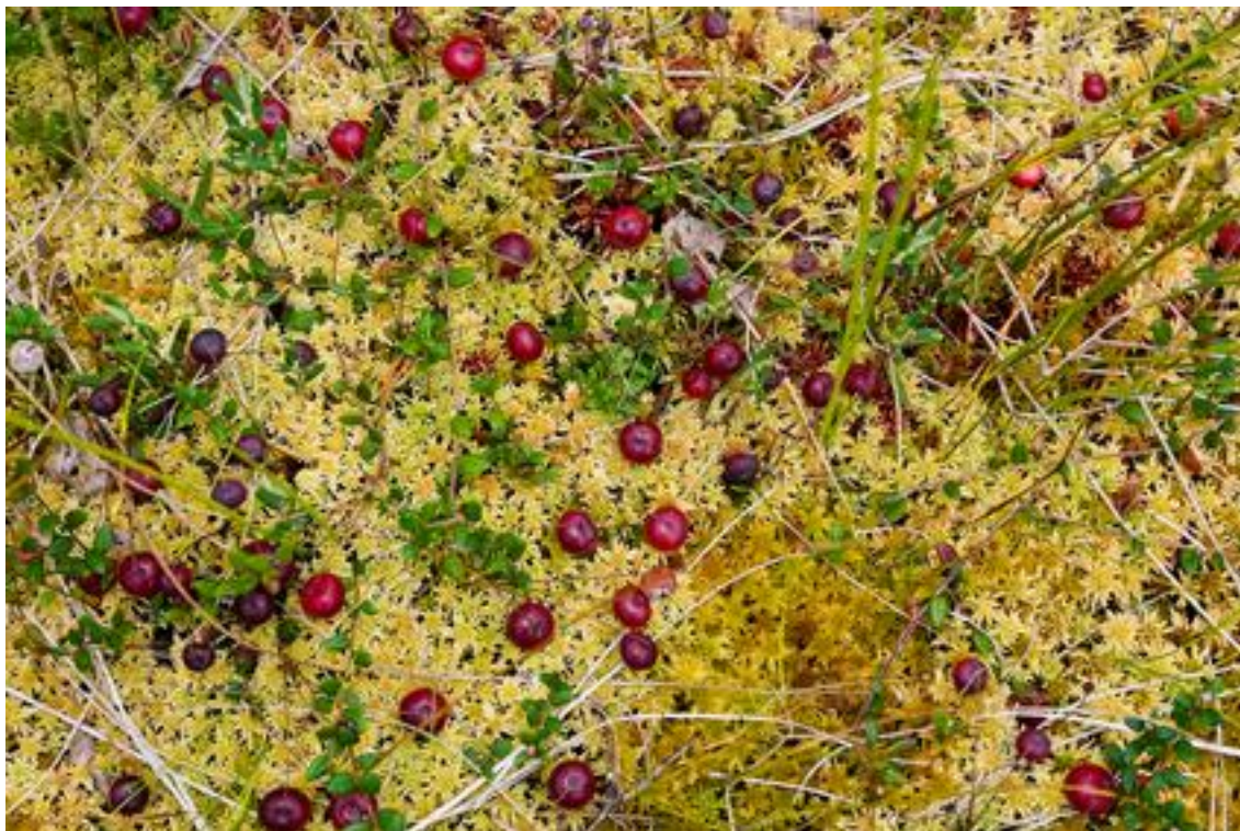
Дикая болотная клюква

высокие грунтовые воды ей не помешают. Уже сейчас можно найти культурные сорта болотной клюквы, такие, как: Краса севера, Дар Костромы, Алая заповедная, Сазоновская, Северянка, Соминская, Хотавецкая.